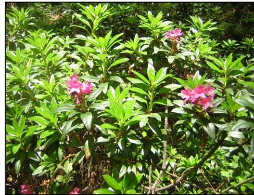
Abarset (o neret)